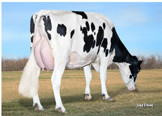
S-S-I BOOKEM MODESTO 7269 FIFTH DAM