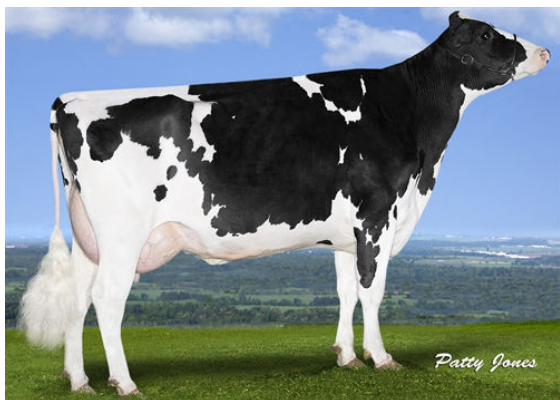
PROGENESIS ENFORCER PAT