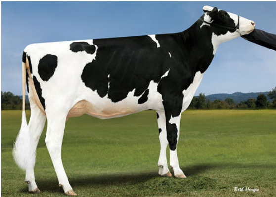
PROGENESIS MODESTY MISSILE GRANDDAM