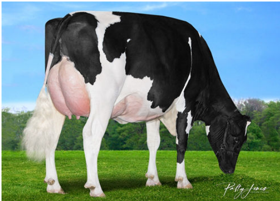
CLAYNOOK ZIVA HOUSE DAM