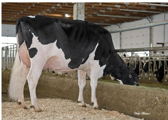
TAPPENVALE MISS UNIVERSE