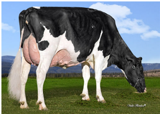
TAPPENVALE MISS UNIVERSE