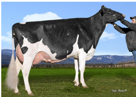
TAPPENVALE MISS UNIVERSE