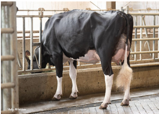
PROGENESIS CHAMPION PALAZZO DAUGHTER