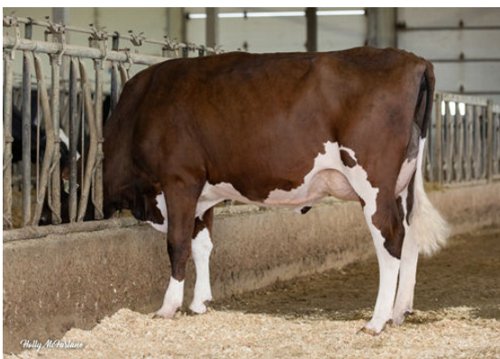
PROGENESIS CHAMPION TIANNA DAUGHTER