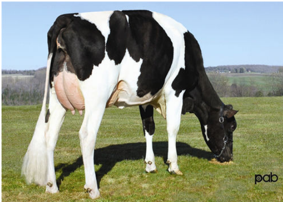
GEN-I-BEQ BOLTON SECRETLY FIFTH DAM