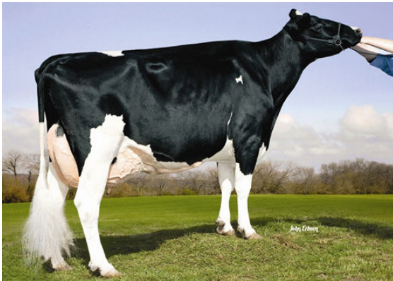
KAMPS-HOLLOW ALTITUDE RC CV TL FOURTH DAM