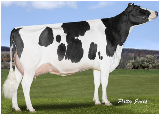
SONRAY-ACRES SOC OBSERVER VI THIRD DAM