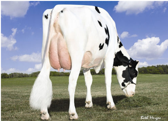
AMMON-PEACHEY SHANA FOURTH DAM