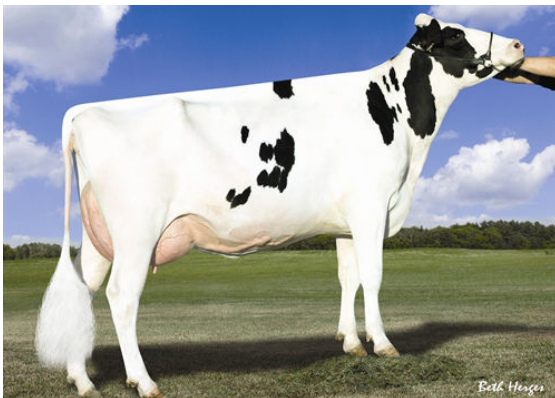
AMMON-PEACHEY SHANA FOURTH DAM