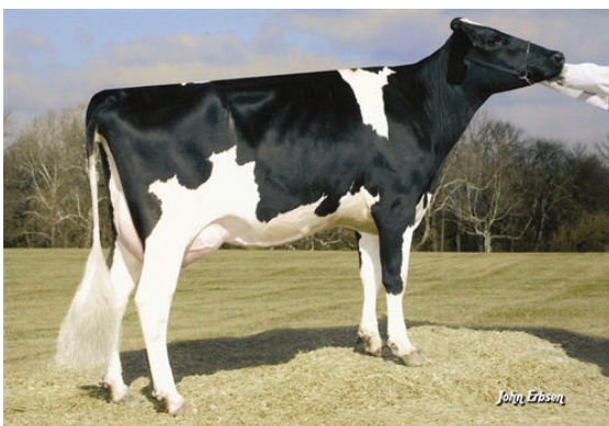
PINE-TREE MARTHA SHEEN TY FIFTH DAM