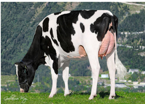
DG CRUSHABULL ATLANTIS