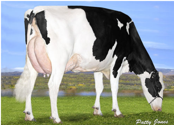
OCD DELTA MISSY