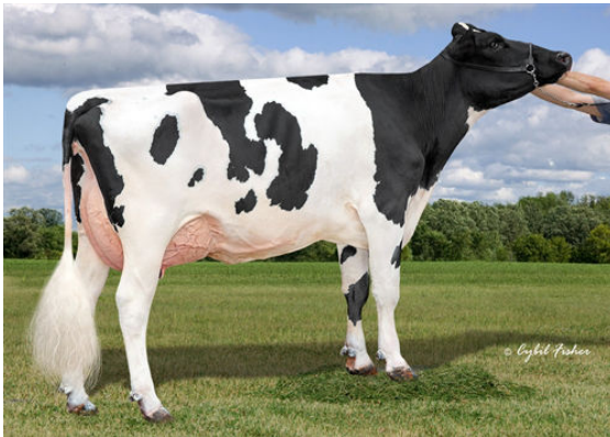
AOT HAWAI HOLLY DAUGHTER