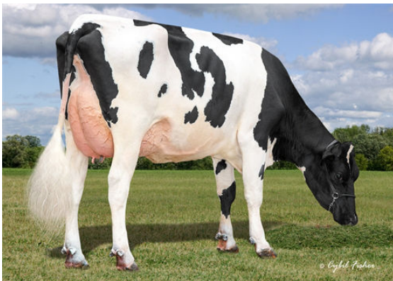
AOT HAWAI HOLLY DAUGHTER