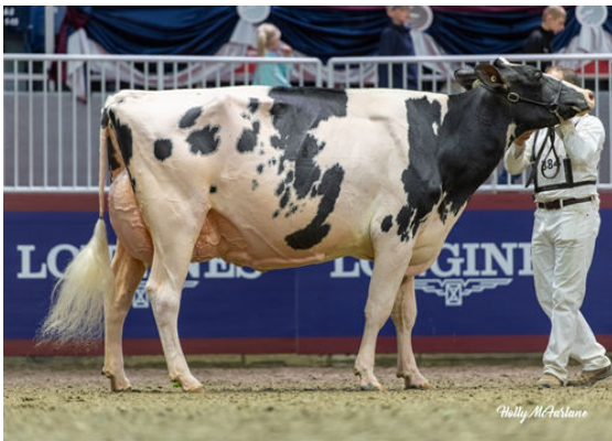
BIRKENTREE SIDEKICK ELLISSIA DAUGHTER