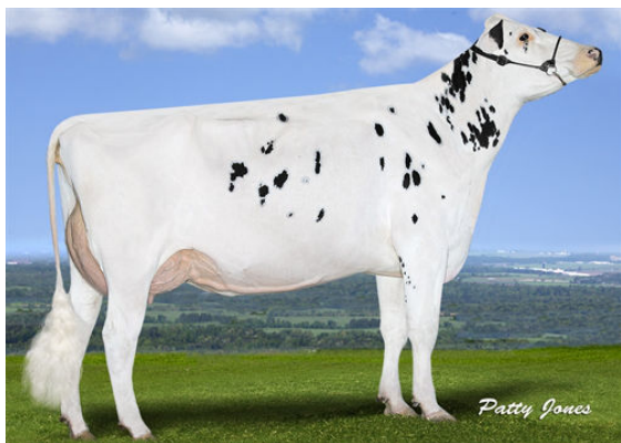
EDG LILLICO UNO 2130