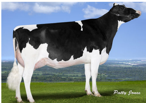
GIL-GAR PREDES MERLOT