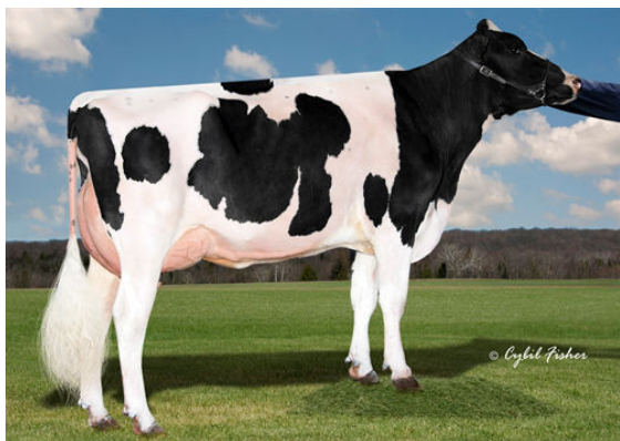
COOKIECUTTER RUBI HOMEY