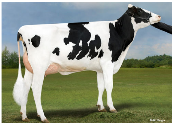
PINE-TREE 7831 LION 598