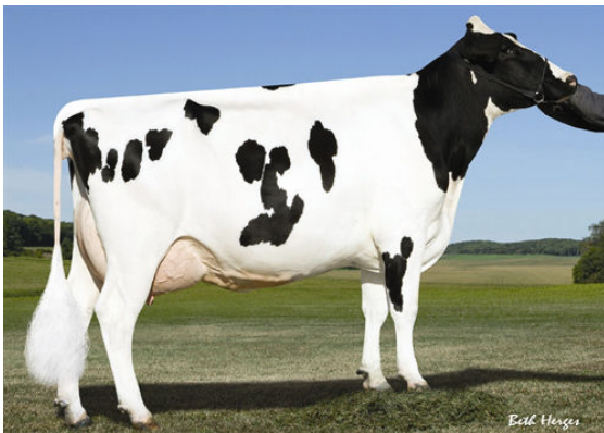
PINE-TREE MONICA PLANETA