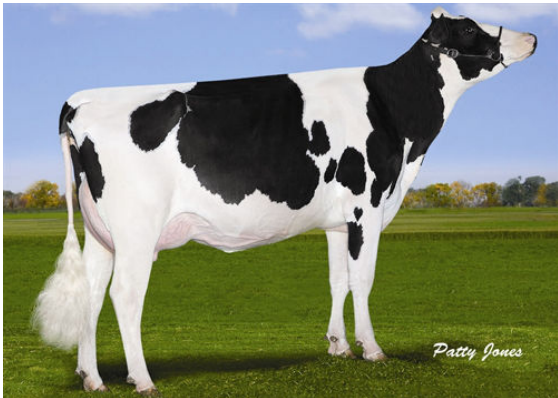
GEN-I-BEQ SNOWMAN SPRING FOURTH DAM