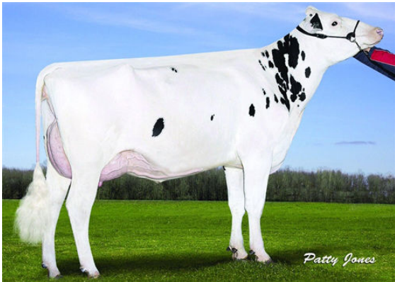
SNOWBIZ BREWMASTER SWAN THIRD DAM