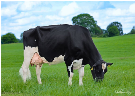
HAH IWANKA DAM