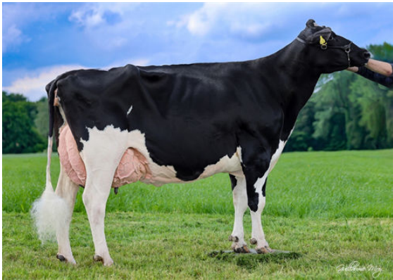
HAH IWANKA DAM