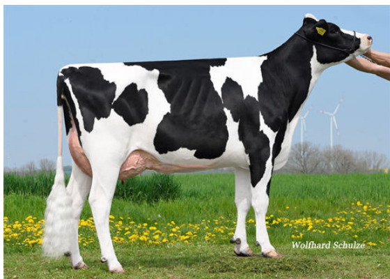
NM PODEST DAM