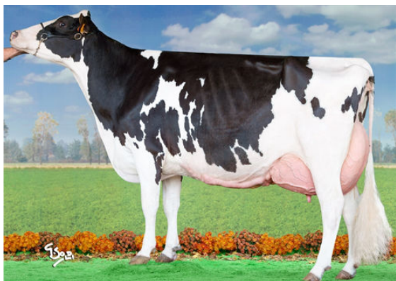
TOC-FARM UNO UDILIA