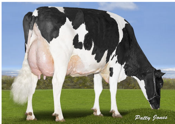
SNOWBIZ N UNO LENA