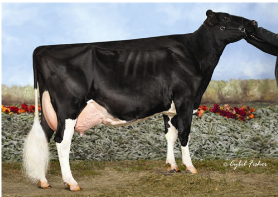
AGRIVENTE SEAVER LORETTA