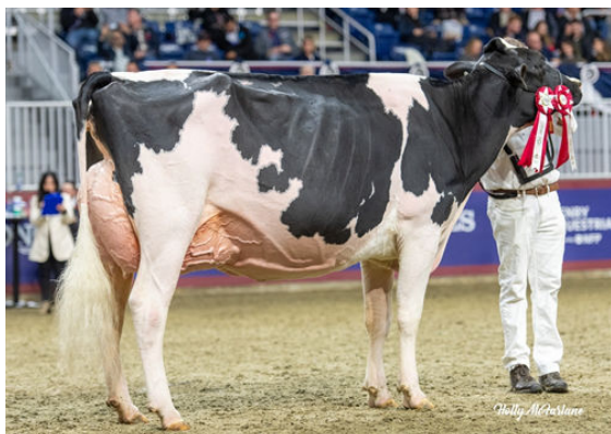
GLENIRVINE UNIX SALLY DAUGHTER