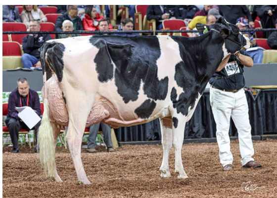
LADYROSE CAUGHT YOUR EYE DAUGHTER