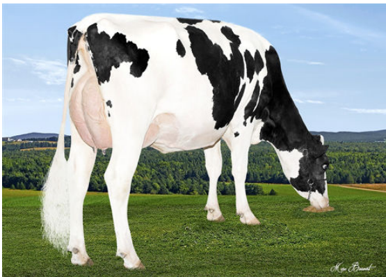
DUTEAU ALBUM INGRID