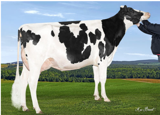
DUTEAU ALBUM INGRID