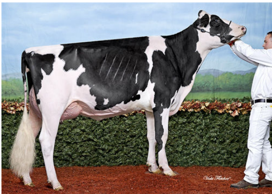
DESNETTE ADELICIA IMPRESSION