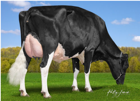
HANALEE IMPRESSION AUDI DAUGHTER