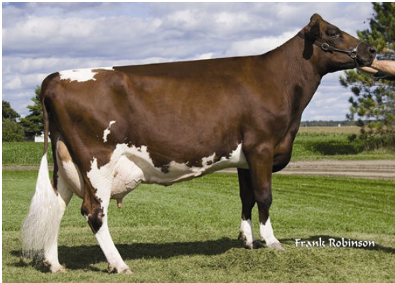
KILDARE PATSY B-JUSTICE FIFTH DAM