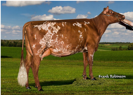
LAROC PREDATOR CONTESS