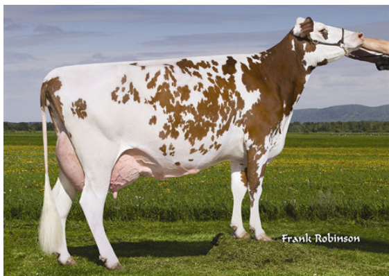
DES FLEURS POKER PARTENAIRE FIFTH DAM