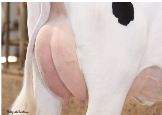
WALNUTLAWN LAMBDA BRIGHT DAM