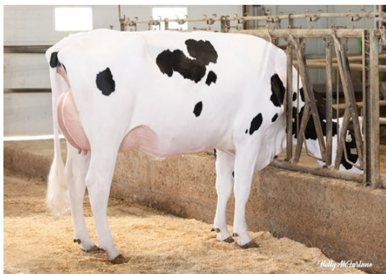
WALNUTLAWN LAMBDA BRIGHT DAM