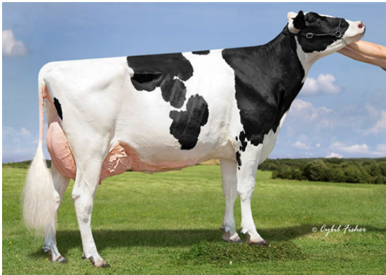
KINGS-RANSOM KROY CLIMAX GRANDDAM