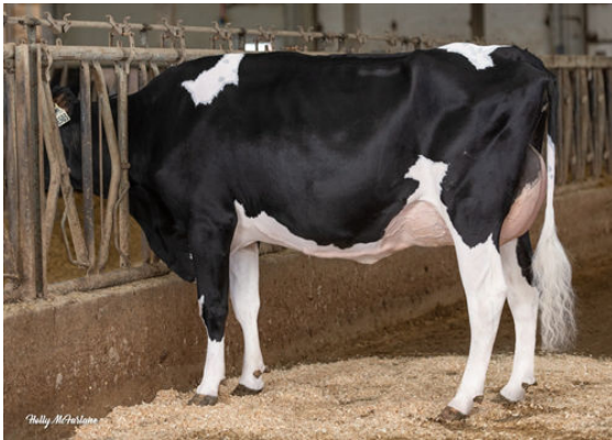
PEAK PLINKO ARLY DAM