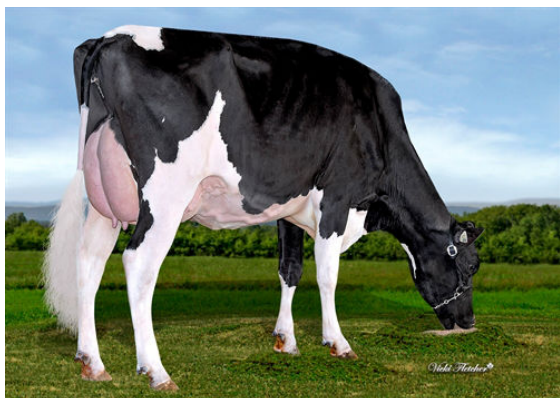
FEPRO PERFECT LINDOR