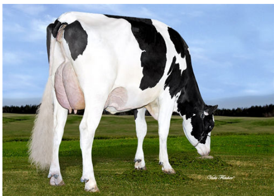
BLONDIN TJR BOMBERO MAPLE