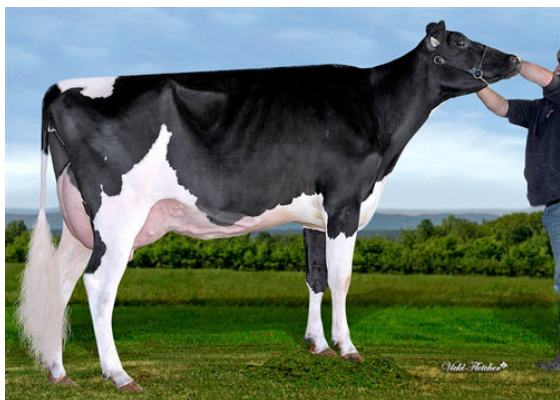
FEPRO PERFECT LINDOR