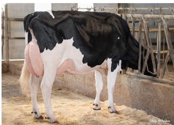
PROGENESIS HIGHJUMP LEADER