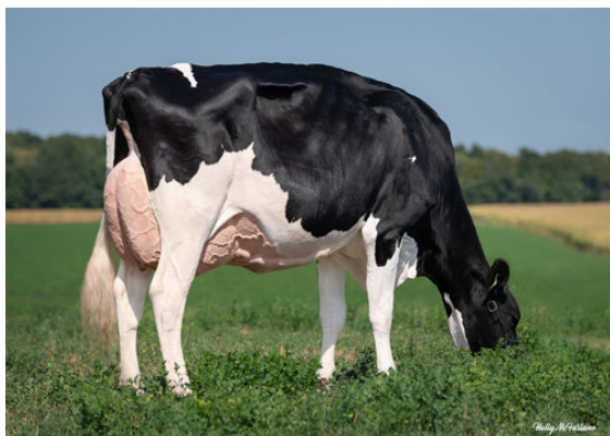
PROGENESIS HIGHJUMP LEADER