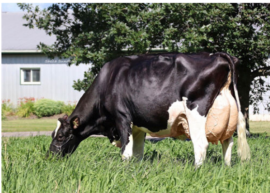
MYSTIQUE EXTREME ABRICOT