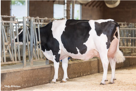
MYSTIQUE LAMBDA ANIS