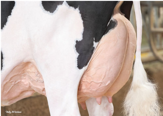
MYSTIQUE LAMBDA ANIS