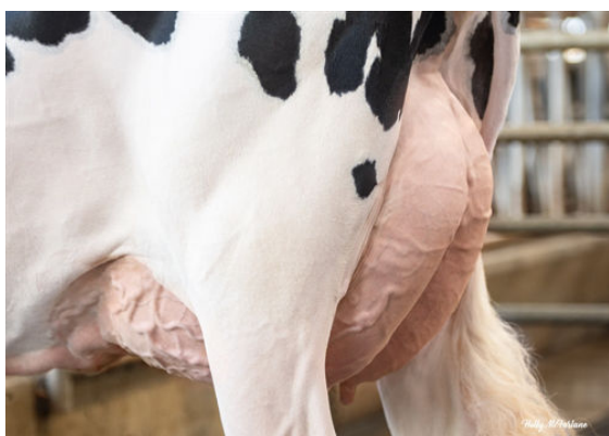
PROGENESIS MANHATTAN PIPER DAM