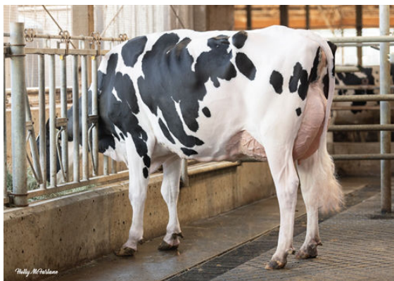
PROGENESIS MANHATTAN PIPER DAM