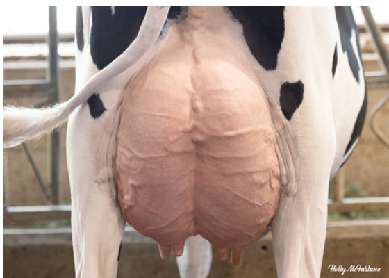
PROGENESIS MANHATTAN PIPER DAM