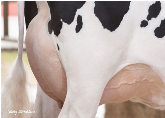
COOKIECUTTER A HOMILY