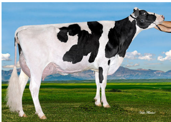
MS SOFIAS DELTA SKY FOURTH DAM