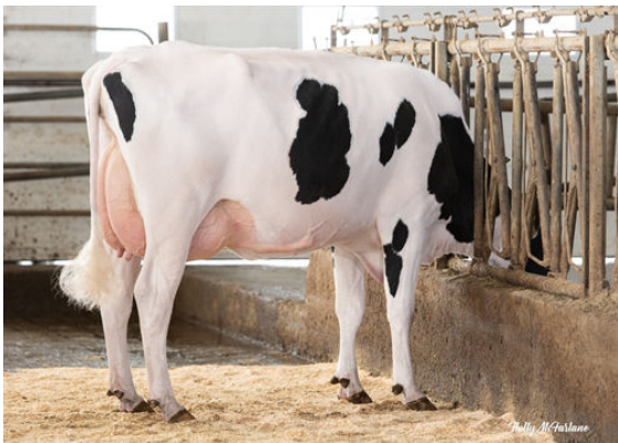
PROGENESIS RIVETING ECCENTRIC DAM