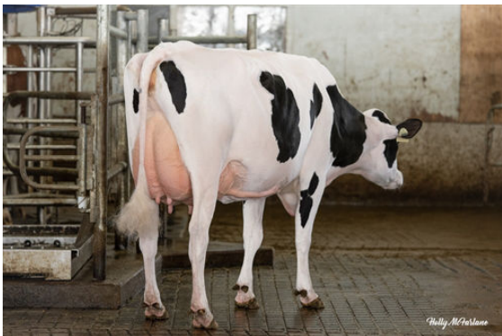
PROGENESIS RIVETING ECCENTRIC DAM