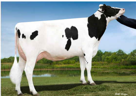
SWAMPY-HOLLOW HOPE FOURTH DAM