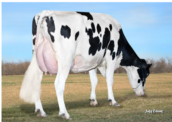
S-S-I BOOKEM MODESTO 7269 FIFTH DAM