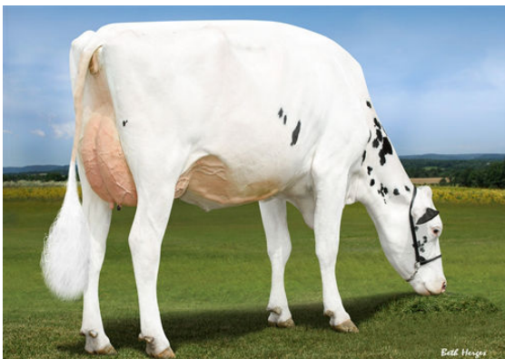
LADYS-MANOR GRNT OOHM