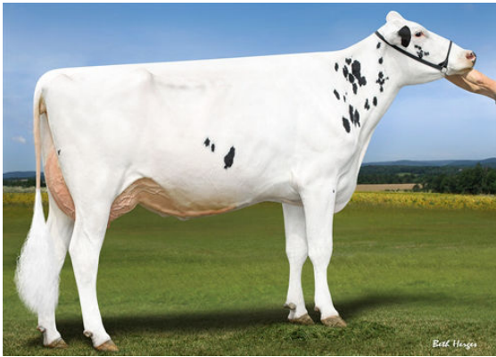
LADYS-MANOR GRNT OOHM