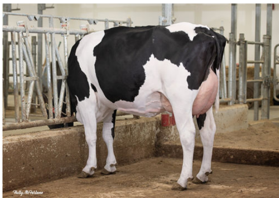
CLAYNOOK ZINCO MONTEVERDI DAUGHTER