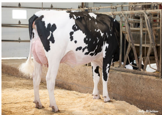
PROGENESIS MONTEVERDI HOTTIE P DAUGHTER