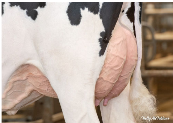
PROGENESIS MONTEVERDI HOTTIE P DAUGHTER