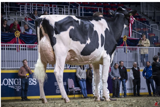
FLORBIL DOORMAN LILLY DAM