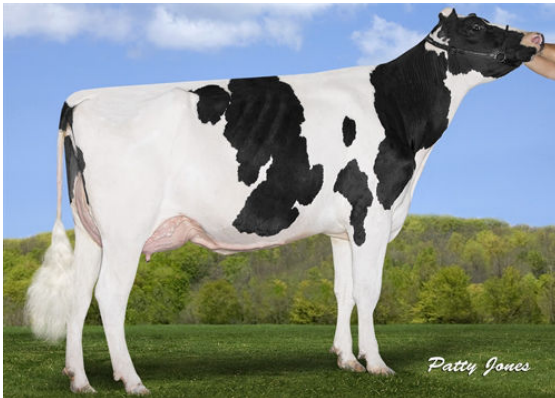
BOLDI V MOGUL AMBER THIRD DAM