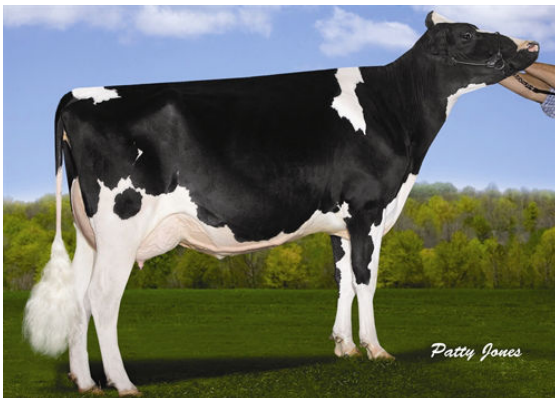
VELTHUIS SG MOM ALESIA FOURTH DAM