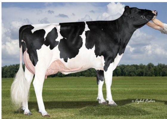
AOT SALVATORE HICCUP