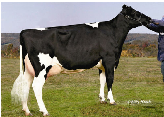
COOKIECUTTER GLD HOLLER