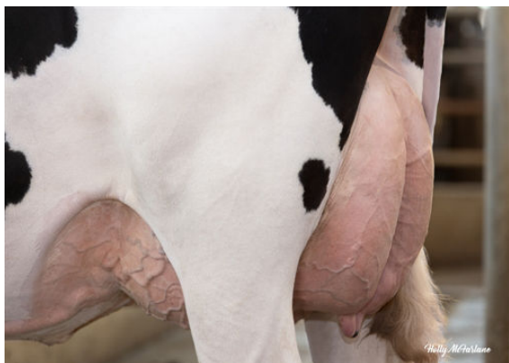
WESTCOAST MNTBLNC FR8167 11529 DAUGHTER