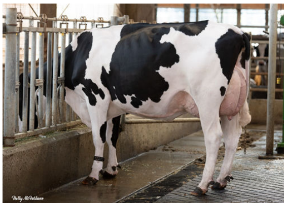
WESTCOAST MNTBLNC FR8167 11529 DAUGHTER