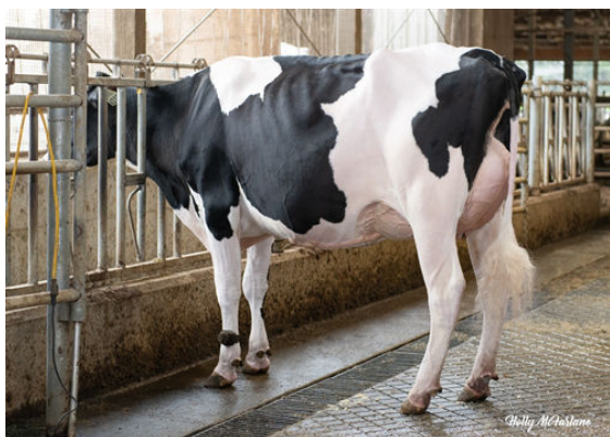
PROGENESIS MONTB ENERGIZER P DAUGHTER