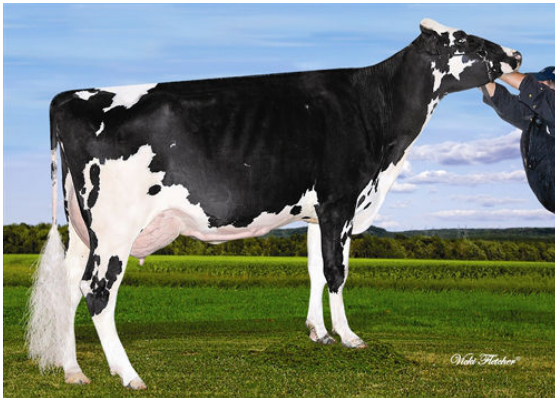
VELTHUIS SUPERSONIC ALYSSA THIRD DAM