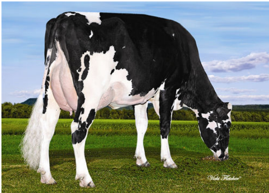
VELTHUIS SUPERSONIC ALYSSA THIRD DAM