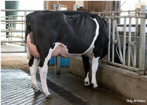
WESTCOAST FSTBL FAR8167 10707