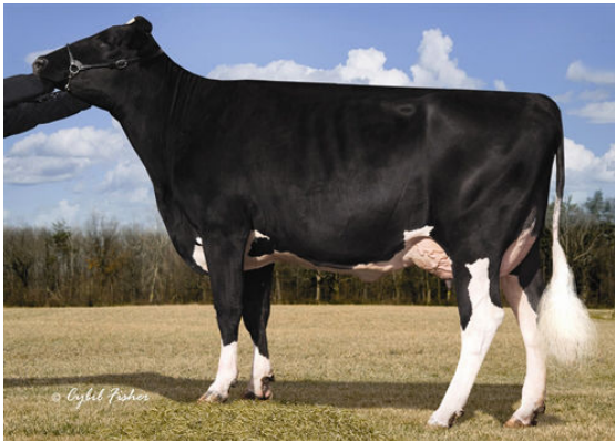
WELCOME BILLION WIOMMI FOURTH DAM